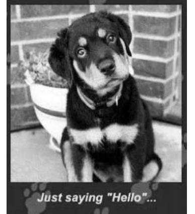
Just saying "Hello"...