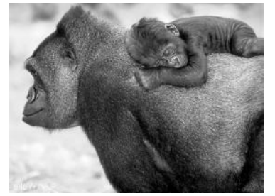
აბაა მოზისი პასუხი.