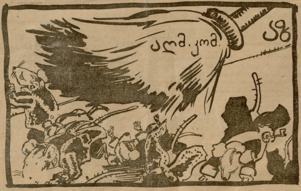
აღმარულებელი კომიტეტი და ჰმეილი წესწუბილიბა.