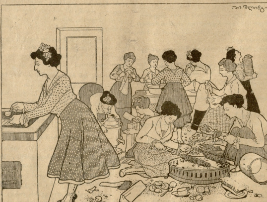
ძაბთველი ქალბის საზოგადო მოლაწავობა.