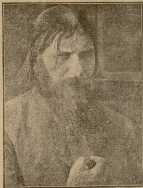
რუსის ბიუვი „მოსხიმი“.

— ყმაწვილებო, სუთ, სუთ,—წასწრჩულა სხვებს ერთმა, დეკანი **) გვიქქერის და შეიძლება მოვიდეს ჩვეთთან. დეკანი, ტან-მორჩალი, ჩამრგვლებული ქსენი, მართლა მიუახლოვდა. მათ დაბლა დაუქრეს თავი და მიესალმნენ.