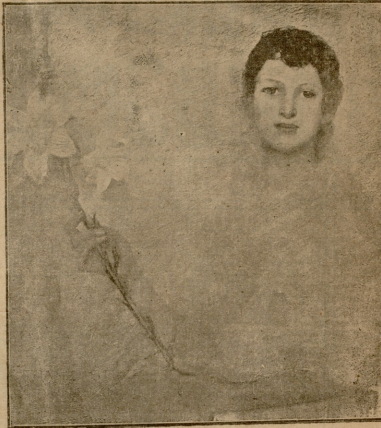
უ ა მ ა ნ ე ლ ი ა .