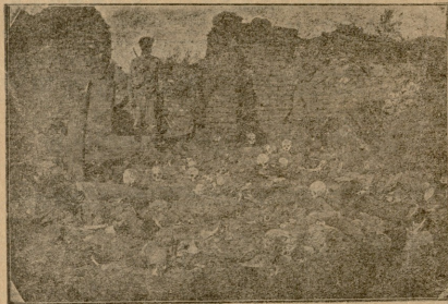
ამხარაშული სომხები. სოფ. შერაფხანი.

მარცხენა იყურებოდა, დაბალი ხმით უძახდა ჩიქოთოს. შინ რომა ბრუნდებოდა, მაშინ დაჰკარგა ჩიქოთო. ვერც კი შეინჩნა, ის როგორ ჩამორჩა უკან. მაგრამ ბნელაში არაფერი სჩანდა. ის ისევ ალაღბებულ მდილიდა, ეამ და ეამ გაჩრდილებოდა, იყურებოდა—ქეთოქით. შიშველი ფეხი მიწელ. დღე ზამთრის სუსტსაგან დასკარბლებოდა, ალბა გრძობდა ქვეს, გაყინულ დღეამწის. ქანიუჭიას არ ეწინოდა არც ღამის, არც ტრიალ მინდორში. ერთი სურდა მხოლოდ, ერთი—გოგინა ჩიქოთო. ყურაში უწიოდა ისევ ფასქილისას სიტყვები—სიმშობით ამოგადრობს სულს, თუ ჩიქოთოს არ მოიყვანო. სიმშობი კი ძლიერი, აუტანელი კუჭს უწევდა საწყალს. თუ მიიყვანდა ჩიქოთოს, პურს აქვედინენ—აი რაზედა ჰფერობდა ქანიუჭია მხოლოდ, მხოლოდ. და მდილიდა აჩქარებული მდილ ორლობებში, მიუკუენებდა, უძახდა, უწიოდა: