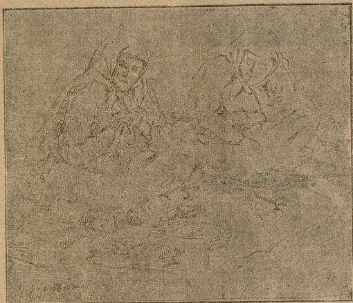
ქრისტე მონაწილე სოფლის დედაკაცებში. ნ.ბ. გულაშვილისა.