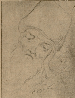
მ. კ. ვ. ა. რ.