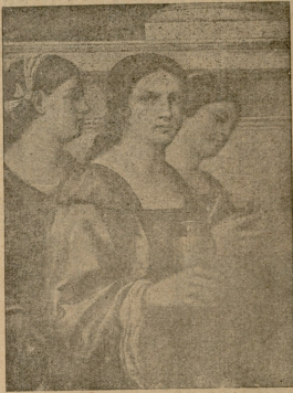
სამი წმიდანი. სებ. დედ-პოზიზ-ს.

ძღვნად თანამომე კალმოსნებს ნოარგმნელისაგან.