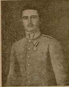
ანსტრისი ახალი იმპერატორი კარლოს 1 (დაიბადა 1887 წ. 17 აგვის.)