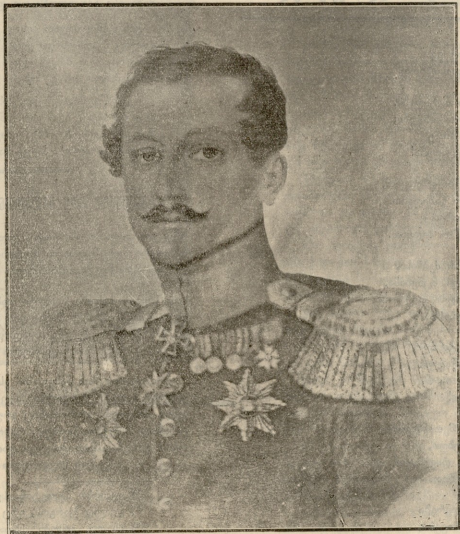
ალექსანდრე პავლიაძე (გარდაცვალების 70 წლ. შესრულების გამო).