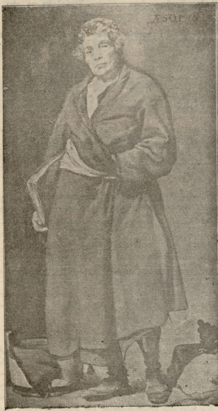
მეჩოპი, სურათი ველასკესისა.

მათ მოსისხლეა ჩემთა ოდეს განვიციდი თვალთა, მიხილულ ვარ მათდამი უხილავითა ძალით, ხან აღმიბატებს თრთილია, ხან შმაგი ცნობა მიფარალით უძრავად ვეძღვარებოდ და ვიფი წვლილის ალით, ოხვრავა მაქვს სიციხისი ნინზად, შესამწვევლად. უწყალო სიყვარული და სხვა.