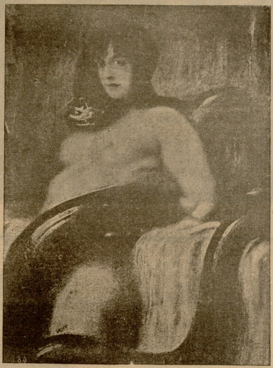
360ბა, სურათი ფრ. შატავა.