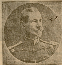
არმიის მთავარ-სარდალი ავერუცუ.

და თუმც მკოცნიდი, მკოცნიდი ნაზად ამბორი ტუჩზე გეყენებოდა. ოხ! ეგრძნობდი მაშინ, ოხ, ეგრძნობდი კარგად შენი აღერსის