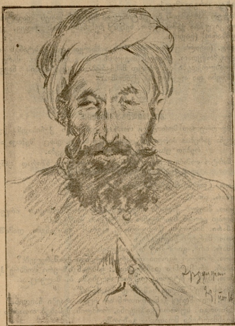
განჯინჯანის ტაძები. მუხთარი (მამახალხის) ნახატ. ბ. ა. გუხაევსა.