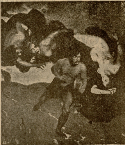
ბოროტი სინდისი, სურათი შტუკია.