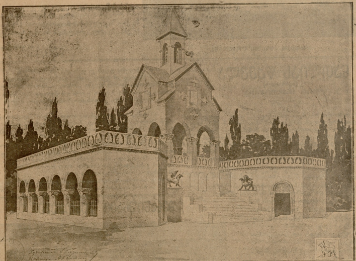
ძართვლთა პანთეონის გეგმა მხატვ. გრიგუცკის და ინჟ. კალენიხისა.