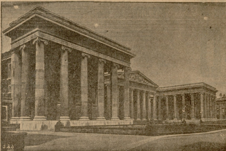
ინგლისის მუზეუმი ლონდონში.