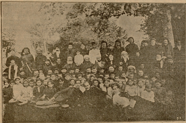
მამადღანე და ძინბიანე ქართულბის ქაქუსიდან.

ფერს დავედ, ხან ერთი წიგნი ავიღე ხალში და ხან მეორე. თავში არაფერი შედიოდა. დაუპატრეებელი ფიქრები ვერაფრით მოვიცილდი... მერე იადვივამ, ალექსის რომ დასკინა? მაშ, ასე მზარულად რაზე ლაპარაკობდნენ?... არა, არაფერი! ღამე იყო, ალბად უფრთხილდებოდა ფეხი არაფერს წაყარასო და ამიტომ ჰქონდა მკლავში ხელი გაყრილი... არა, არა! იადვივა კეთილი ქალია!..