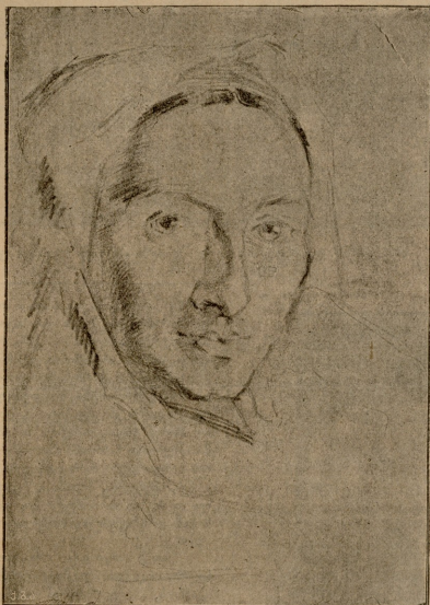
უხდენელი ძალი. ნახატი ხალი-ზეგ-მუნავიისა.