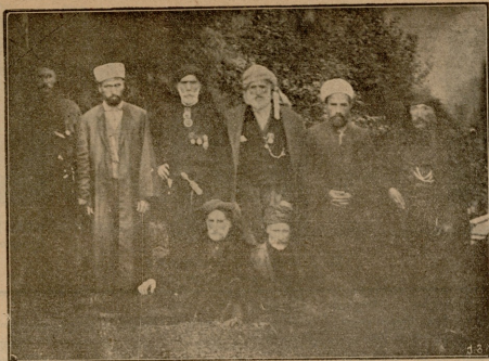
ქართული მამადღანები სოფ. ქაქუთიდან.