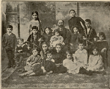
შიო მღვიმელი ბავშვთაში.