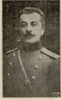
პოლკ. თაგ ღვზან მამაცაზვილი (მოკლულია)