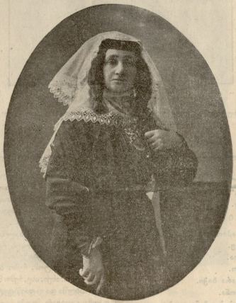
ელ. ჩარქეზიძის უკანასკნელი სურათი.