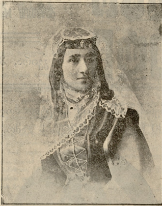
მლ. ჩარაქიხვილი ახალაზარდობაში სურათი გადაღებულია 1886 წელს როდესაც იგი პირველად გამოვიდა სტენაზე.