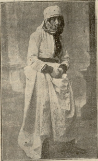
„სამგორი წლის არხიში“, (ოსი-მთალი).