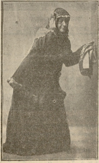
„ჯიბა ღანჩოცის მარა ღამოკ- წილდინი“ (ელისაბედის!)