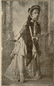
„უნდა შიდიხანით“ (გაზაფხულის ცოლი).