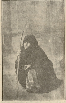
„სამოცი წლის არაფერი“ (ზორეშანი).