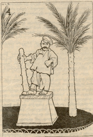
მინაბერის მინაბერის მ. მინაბერის მინაბერი „საბალ-კლუბში“.