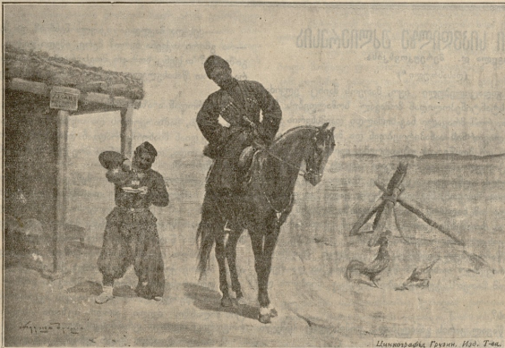
საქართველოს საბჭოთაო საქართველო