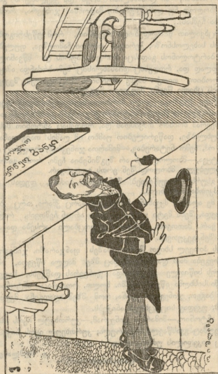
კ. მინაბერი: საბალსო ფრანკლი, მინაბერი მინაბერი...