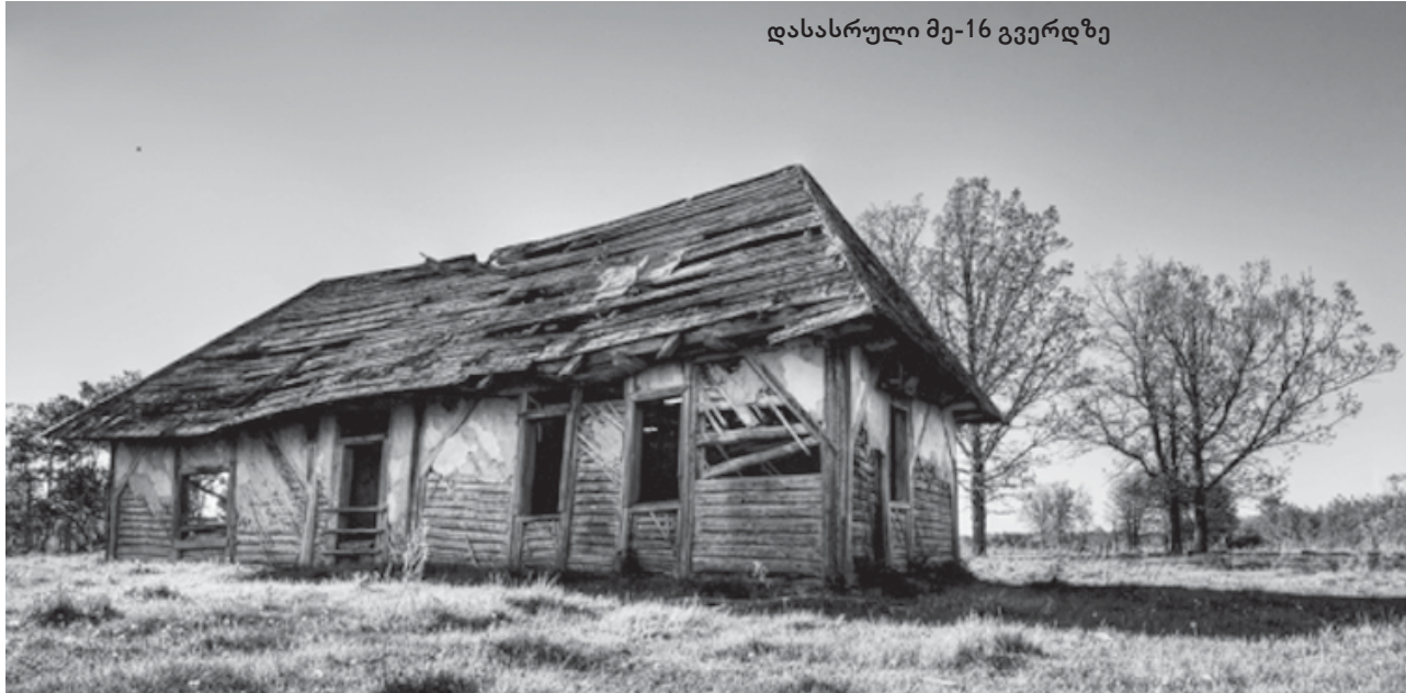
დასასრული მე-16 გვერდზე