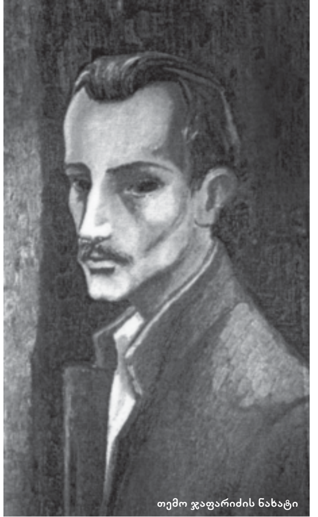
თემო ჯაფარიძის ნახატი

პროსპექტი – ერთი ნაწილია ამ წიგნისა, – ეს წიგნი შედგება მრავალი თავისაგან: