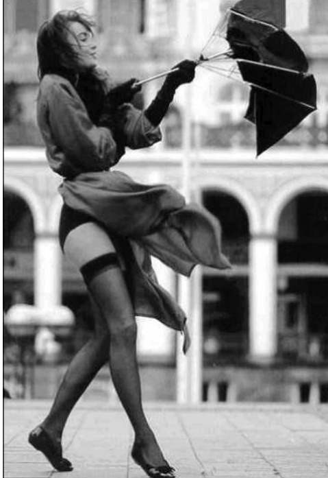
თუ სწორად აღიზნით მარჯვნივ მოთავსებულ იაპონურ ნახატს, მიხვდებით, რომ ამ „ქარწალებულ“ ქალბატონის ქოლგას სხვა დანიშნულებაც გააჩნია.

254. ქალი მიმართავს გინეკოლოგს: - ჩემამდე სხვა ქალები გყავდათ? 255. - გეივკე... მანგიორი ჭიჭიკია დენს მოუკლავს! - რაფერ, შე კაცო?! - აკუმლატორი მოხვდა თავში! 256. y p p p , py - p p p p y - p p ? p p y p p ! 257. H " : " H "