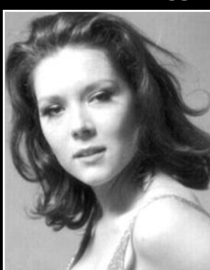
76. Kathy Ireland