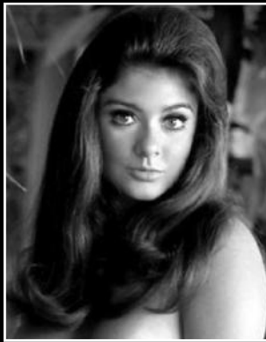
75. Diana Rigg