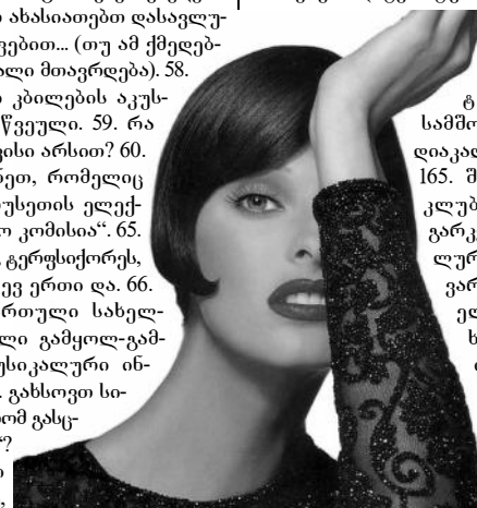
შეაღწინა ვახო უკრაინული