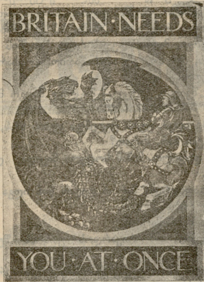
ამ სურათს წარწერა აქვს:

ქუჩაგზი გამოკრულია პლაკატებით ასეთი სურათებით და წარწერებით