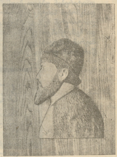
ვ. ა. შ. ა. - ფ. შ. ა. ვ. ე. ლ. ა.