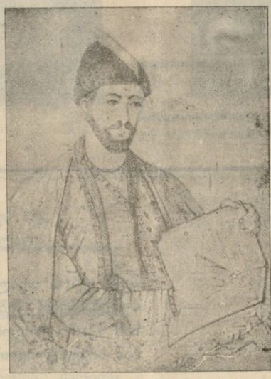
შ. მ. თ. ა.