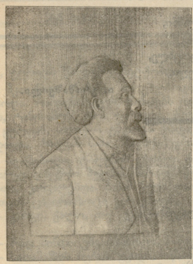
ა. კ. ა. კ. ი.