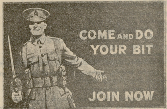
შეასრულე შენი მოვალეობა — ჩაეწერე ჯარში.