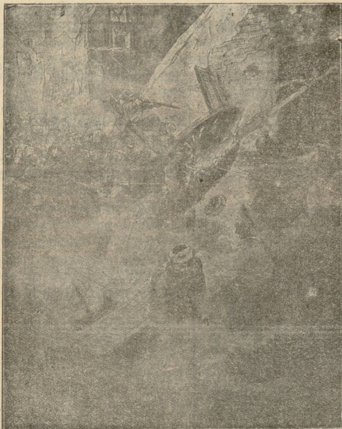
თაბიურის გორაკი: თავგანწირული ხელჩართული ბრძოლა გერმანელებისა და ფრანგებისა