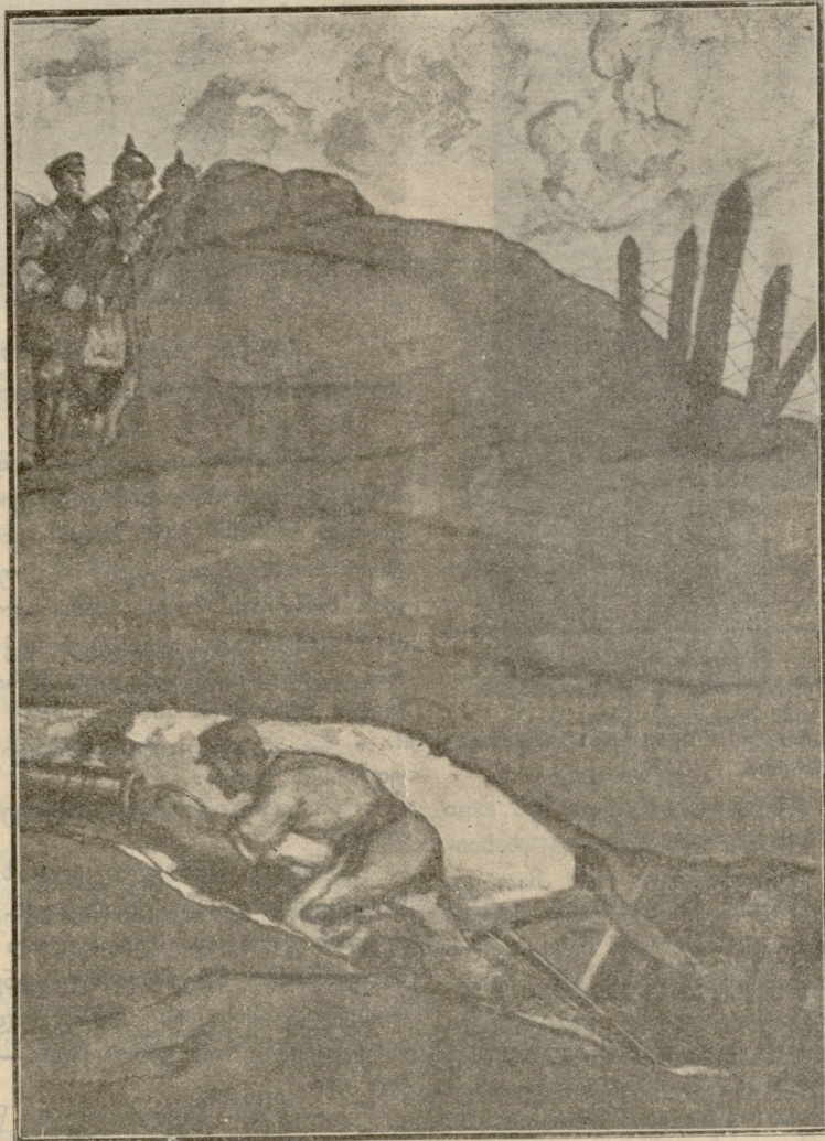
საოჯახო ბრძოლა: გერმანელების სანგრებს ქვეშ ფრანგებს სანაღ- მე გვირაბი გაუყვანიათ. მიწის ქვეშ მენაღმე ნაღმს ასაფეთქებ- ლად ამზადებს.