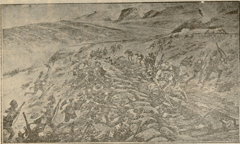
პირველი პოზიციების გამაგება.