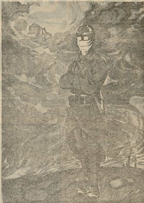
სულის უმეხუთავი გაუვალი საშიში ალარ არის!..