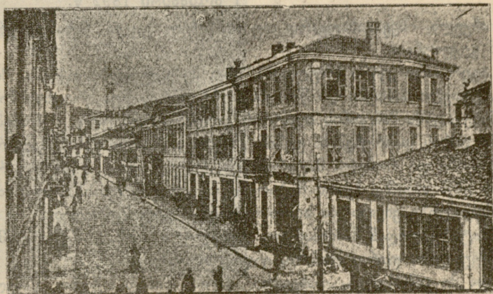
სურათი: გამიდიეს ქუჩა ქ. მონასტირში.