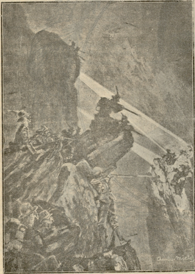
იტალიის ჯარი. ალპის მსროლელთა რაზმი მწვერვალოებზე.

ისევ ია, სინიორინა! ესენი გეტყვიან, რასაც ვფიქრობ თქვენზე. მარიო.