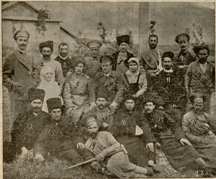
სერნოვოდსკის ლაზარეთში მყოფი დაჭრილი ქართველი ჯარის კაცები.