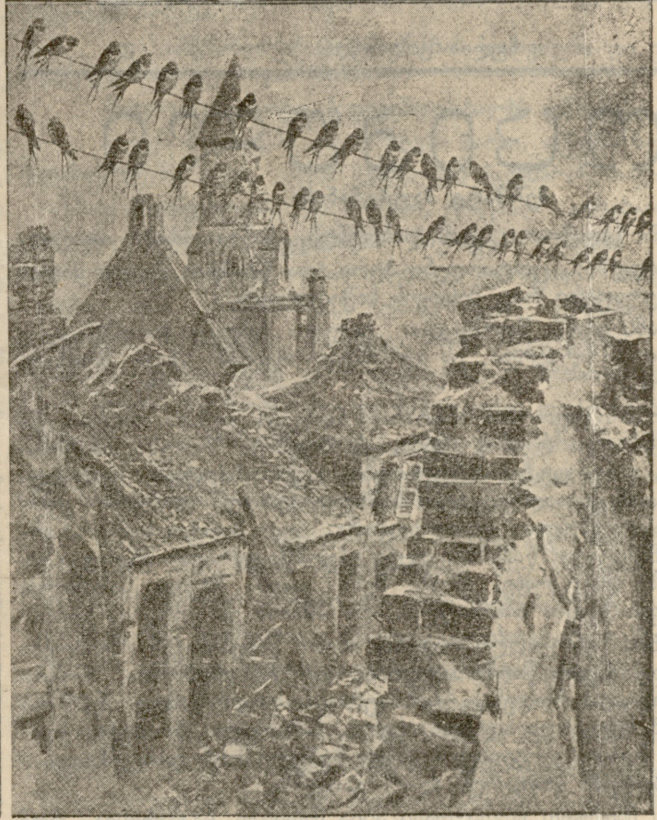
1) ინგლისელთა იერიში—სიშტებით და ხელით სასროლ ყუმბარებით. 2) ყუმბარებისაგან განადგურებულ ქალაქში არც ერთი ცოცხალი არსება აღარ დარჩენილა, მხოლოდ მერცხლები დასტორიან ნანგრევებს გაფრენის წინ.