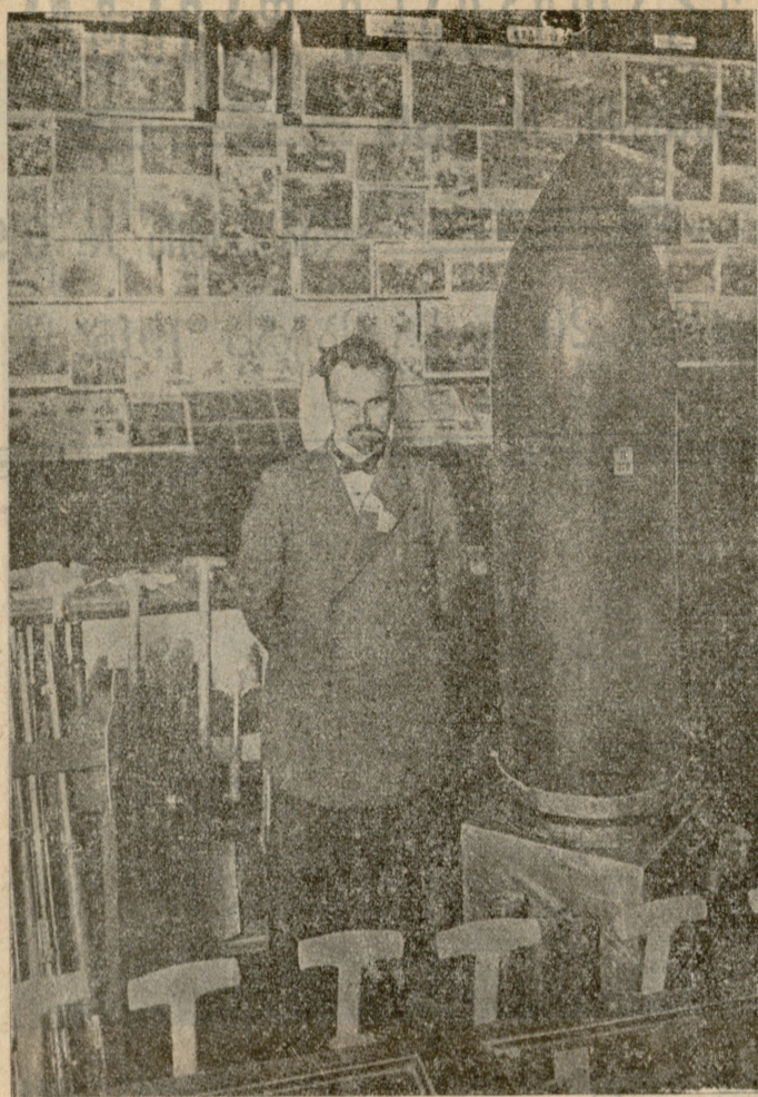
გერმანელების 42 სანტიმეტრიანი ზარბაზნის ყუმბარა რომელსაც რუსები „ჩამადნებს“ უწოდებენ.