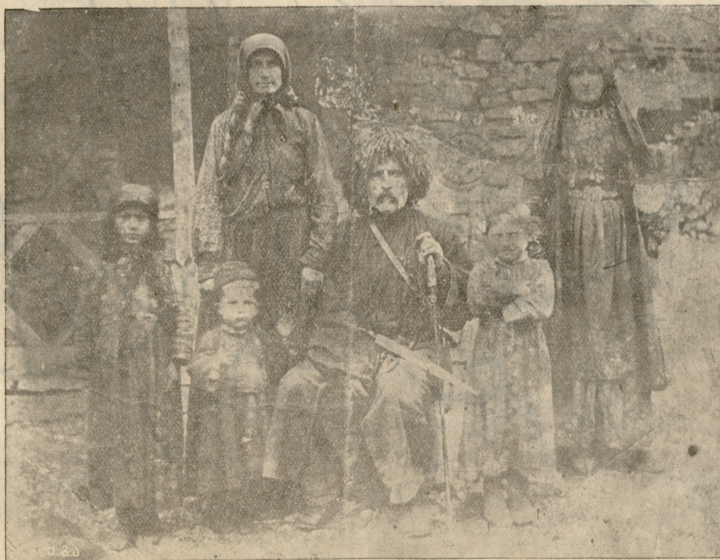
ვაჟა-ფშაველა ცოლ-შვილით ს. ჩარგალში თავისი სახლის წინ. სურ. გადაღებულია 1907 წელს