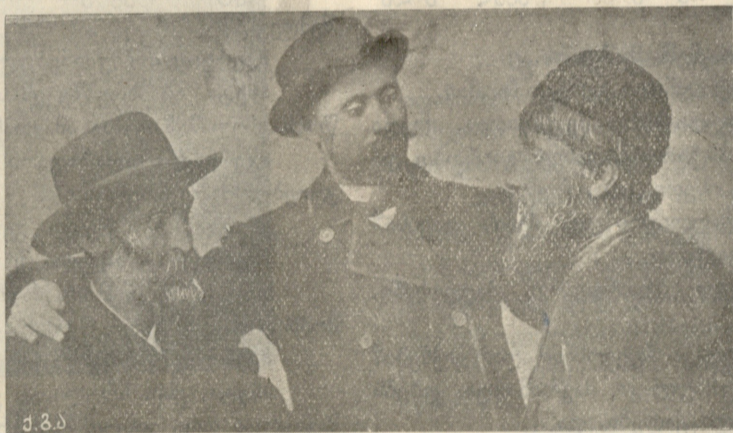
დimitრი მაჩხანელი, შიო მღვიმელი და ვაჟა-ფშაველა.