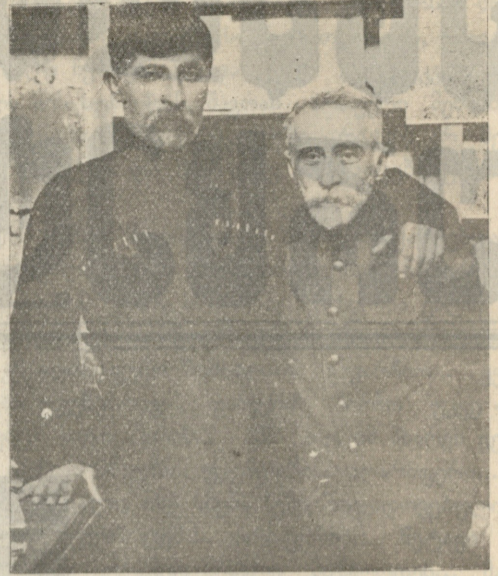
ვაჟა და ღვთისმშობელი კლდიაშვილი.