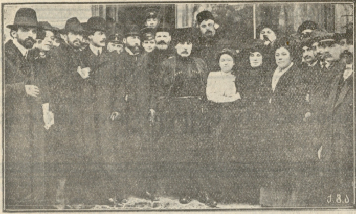
ვაჟა-ფშაველა ქუთაისში 1913 წლ. 20 თებერვალს. მის გარშემო სდგანან ქუთათური ახალგაზდა მწერლები.