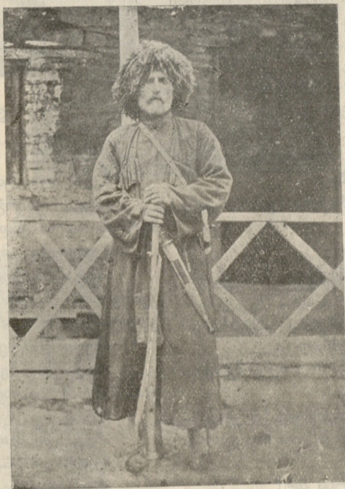
ვაჟა-ფშაველა მთაში თავის სახლის წინ.