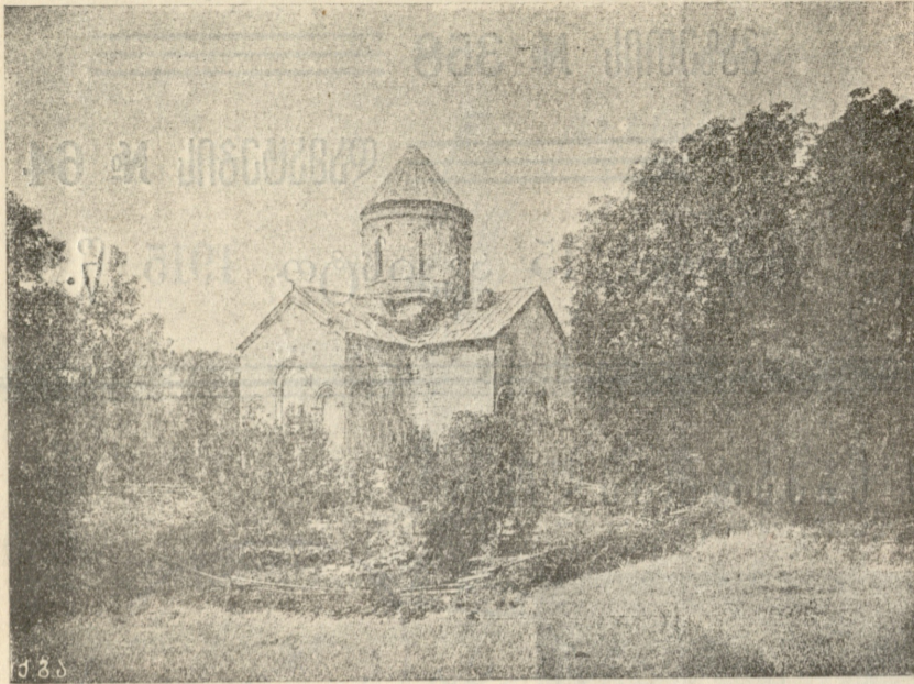
ტბათის ტაძარი (ართვინის მ.)