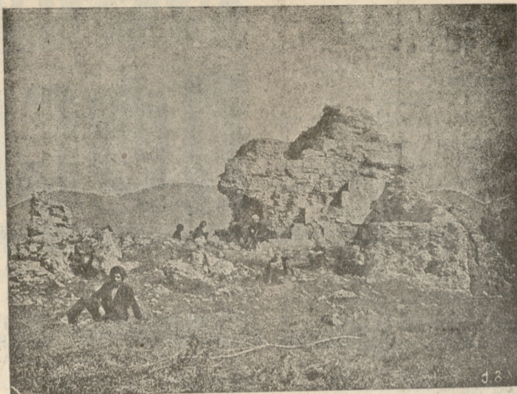
ანჩის ტაძრის ნანგრევები.