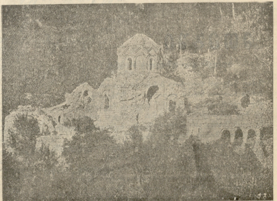
ოპიზას მონასტრის ნანგრევები.