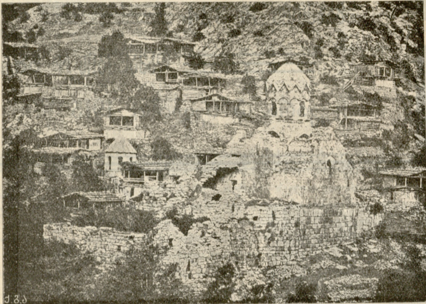
შატაბერი (ახლანდელი პორტა).

სამაჰმადიანო საქართველო ანუ შველი მესხეთი