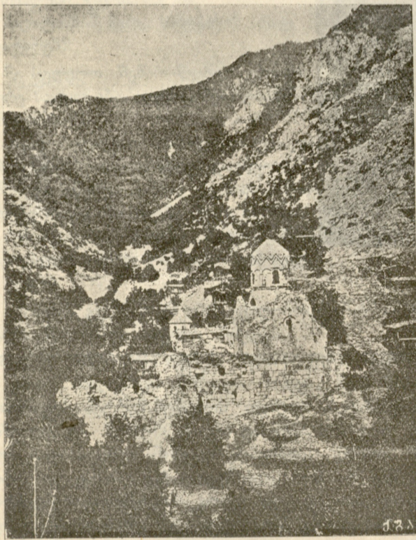
შატაბერის ტაძრის ნანგრევები.