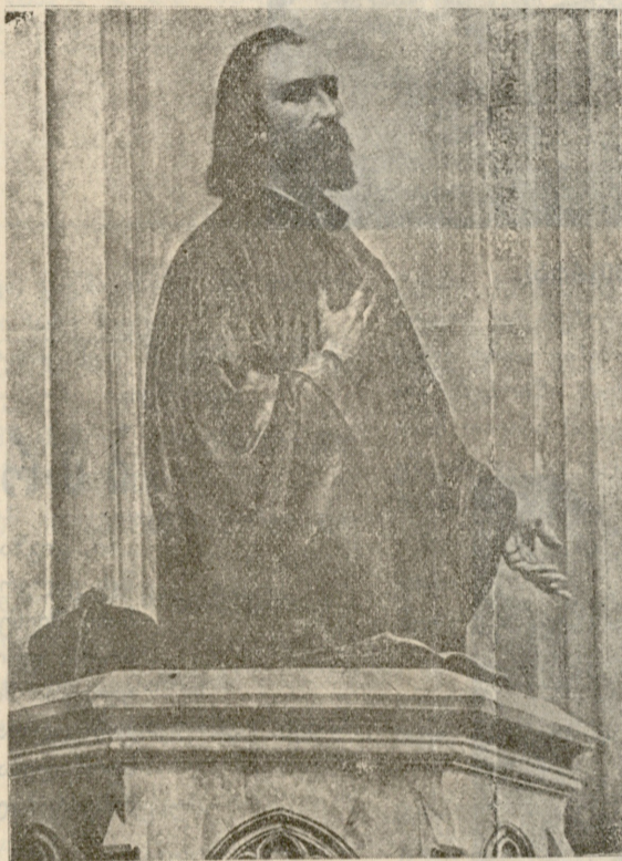
იანე ჯუში. (1869—1915) იხ. დღევ. „სახ. გაზ.“