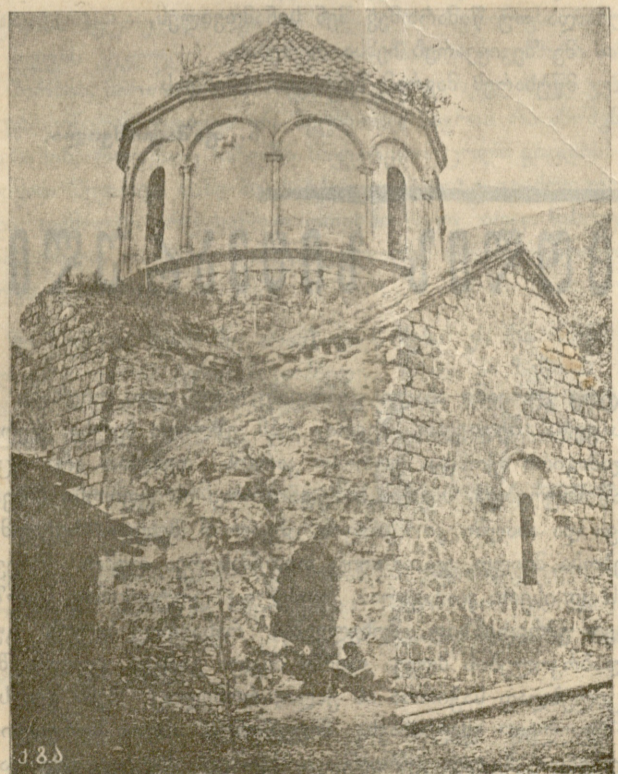
ლოლის ხანის ტაძრის ნანგრევები.