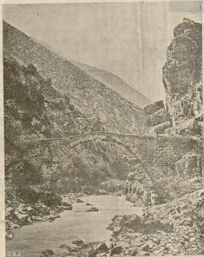
ძველებური ხიდი იმერეთის ვალზე.