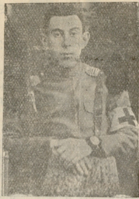
ფრეიტორი დომენტი დვალი-შვილი (უკვალოდ დაიკარგა).