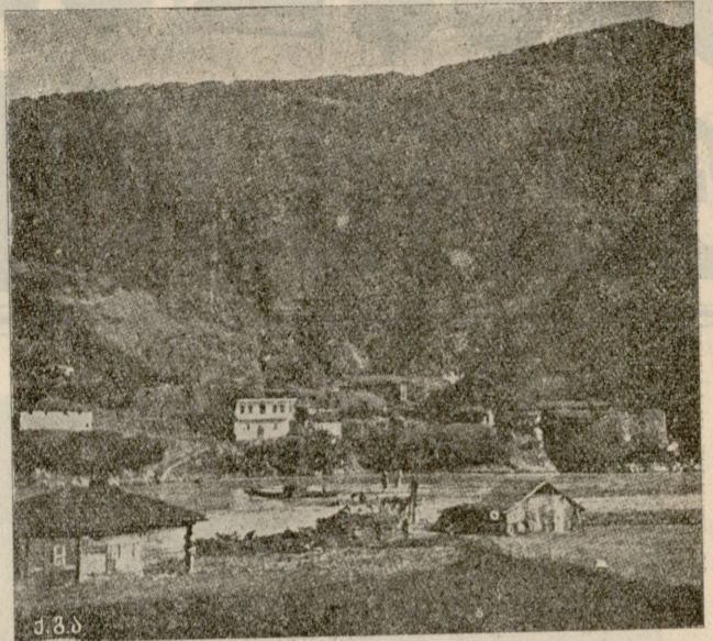
სოფ. ბორჩხა (ბათუმის ოლქი).

დათა. (ხელებს გაუშვებს. ცდილობს დამწყნარდეს და გონს მოვიდეს).