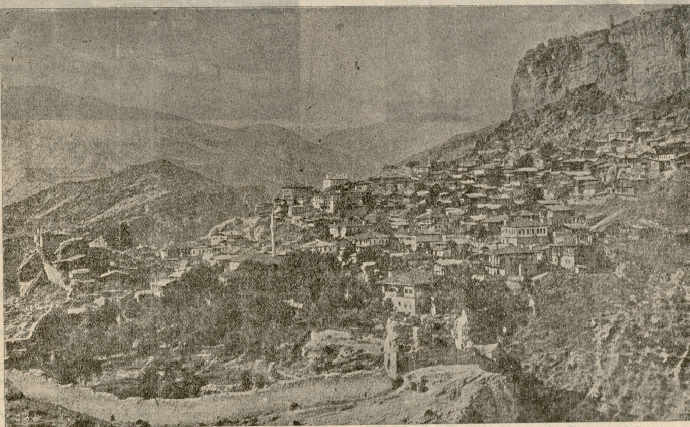
ართანუჯი, ძველი სატახტო ქალაქი ტაო-კლარჯეთის ბაგრატიონებისა.