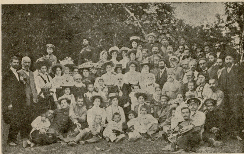
აკაკი ხონში იუბილის შემდეგ გამობრუნებული, ხონელებმა სოფ. გუბამდე მამოაცილეს სადაც დაარსებულია მისი სახელობის ბიბლიოთეკა.