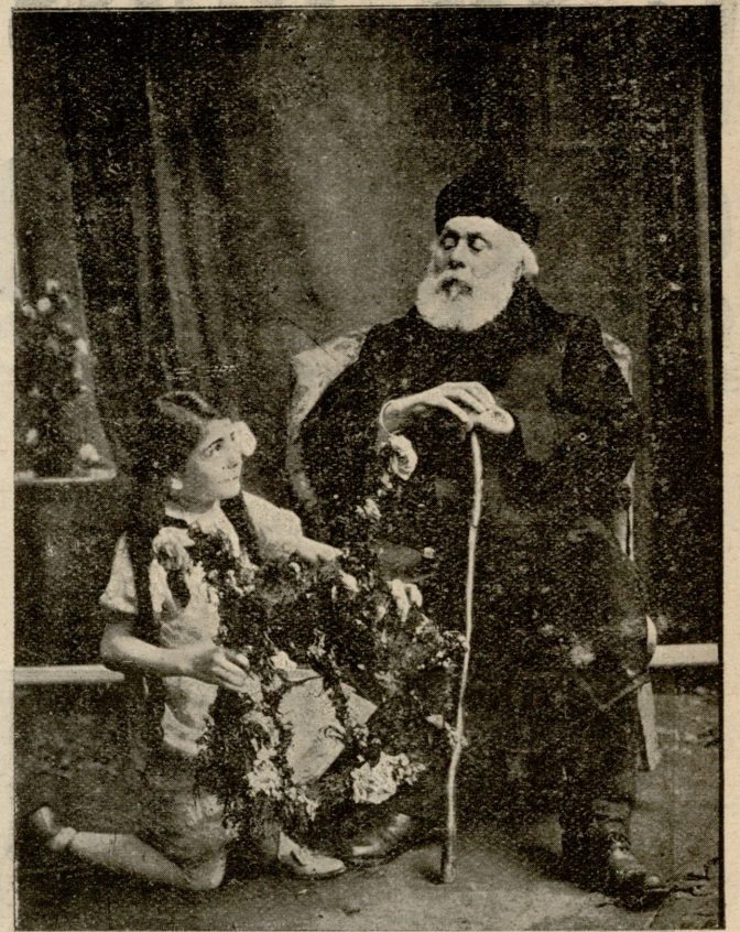
აკაკი ზუგდიდში ყოფნის დროს 1912 წელს. მის სახელობაზე დაარსებულ სამკითხველთა კურსების დროს. (პერიდის პატარა ქალთან რომელმაც ქნარი მიართვა).