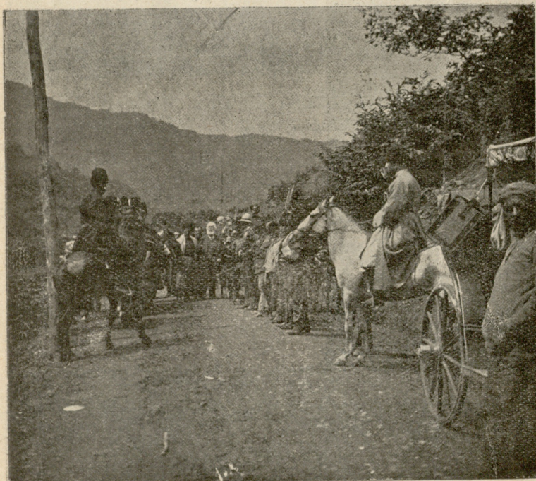
აკაკი რაჭაში მოგზაურობის დროს.