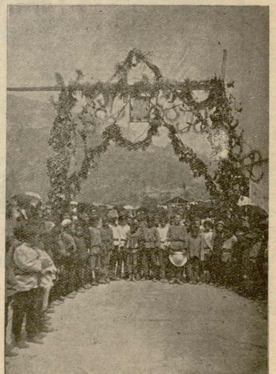
სოფ. ტრეზალო (რეპა ლენხუმას საზღვარზე) სატრიუმფო კამარაჟაკაქისათვის.