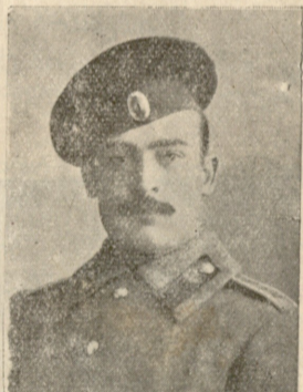
პრაპ. ივანე ახალკაცი (დაჭრილია)