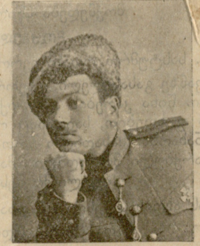
პოლ. იოსებ კობახიძე (დაჭრილია)