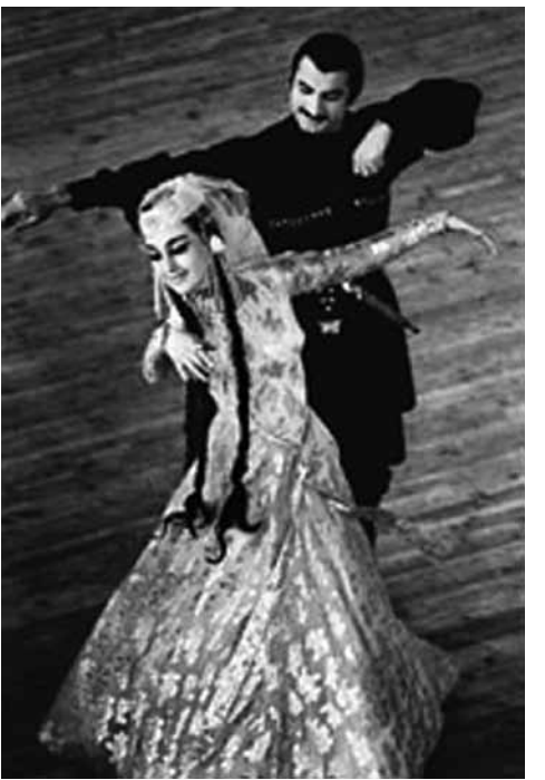
ცეკვის მუსიკა... ჩვენ არ გვჭირდება უცხო ქვეყნის მელოდია...

მისი სხვა ნაწერებში, საგაზეთო ინტერვიუები საერთო, საზოგადოებრივ ინტერესებს ეხმაურება: „ოცდამეერთე საუკუნე, თანამედროვეობა არ ნიშნავს, მოგშალოთ ეროვნული, ყველაზე მთავარი, შევინარჩუნო ქართული