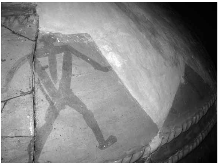
მაკაცთა ძირითადი მდგომარეობები, ექსპრესიული მოძრაობები, უდავოდ, ქართულია და, ვფიქრობთ, უძველეს საფერხულო ცეკვის არსებობას ადასტურებს. ურა დვალისვილი, ხელოვნებათმცოდნეობის დოქტორი, პროფესორი

1966-75 წლებში მრავალფეროვანი არქეოლოგიური ძეგლის გათხრებს აწარმოებდა სიმონ ჯანაშიას სახელობის საქართველოს სახელმწიფო მუზეუმის არქეოლოგიური ექსპედიცია იულონ გაგომიძის ხელმძღვანელობით. არქეოლოგიური მასალა სრულყოფილად ასახავს ძვ.წ. IV-II საუკუნეების ქართლის მოსახლეობის ნივთიერი და სულიერი კულტურის თითქმის ყველა მხარეს. ისტორიული ელინისტური ხანის სამადლოს სამოსახლარის არქეოლოგიური მასალის შედეგად მტკიცდება, რომ ძვ. წ. IV-III საუკუნეებში საქართველოში არსებობდა მაღალგანვითარებული მხატვრული კერამიკის წარმოება. სამადლოს მასალებიდან მეტად მნიშვნელოვანია კერამიკა – უმთავრესად კი მოხატული (მოჭიქული): სხვადასხვა დანიშნულების, მრავალფეროვანი და მრავალფეროვანი თიხის ჭურჭელი – შედარებით უხეშად ნამზადი ქოთნები თუ ვირთუოზულად დამუშავებული სარიტუალო ჭურჭელი და ტექნიკურად უზადო თხელკედლიანი საღვინე ქვევრები. ამგვარი სასმისები ძველი ნელთალრიცხ-