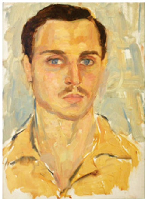
ალექსანდრე ციბაძის პორტრეტი