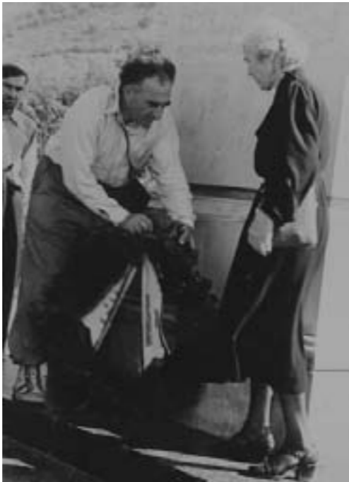
ლევან გოთუა და ალექსანდრა ჯაფარიძე წიწამურში, ილიას ობელისკთან

წელს ქართული ალპინიზმის 90 წელი აღინიშნება. თვალს თუ გადავაკვლით ქართული მთამსვლელობის ისტორიას, დავინახავთ, რომ მის სათავეებთან თვალსაჩინო მოღვაწეები და დიდებული ქართველი მამულიშვილები იდგნენ. მათ შორის, ვინც თავისი წარუშლელი კვალი დატოვა მთამსვლელობაში, იყო ქართული მწვერლობის კლასიკოსი ლევან გოთუა, რომელმაც არაჩვეულებრივ მოთხოვნებთან და რომანებთან („გმირთა ვარამი“, „მითრიდატე“) ერთად, შესანიშნავად აღწერა თავისი ლაშქრობები კავკასიონის მწვერვალებზე, რომელიც გადასახლებიდან დაბრუნების შემდეგ ერთ წიგნად აკინძა „მგზავრული კრიალოსანის“ სახით..