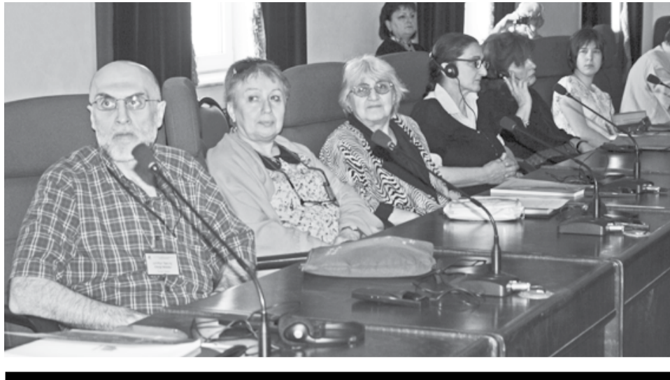
კონფერენციის მსვლელობამ პრაქტიკულად ლოგიკურად მიგვიყვანა იმ იდეამდე, რომ ლექსიკოგრაფიის ნაშევან დარგად ჩამოსაყალიბებლად გვეჭირდება ქართული ენის ეროვნული კორპუსის შექმნა. მისი რესურსების გარეშე სრულყოფილი განმარტებითი თუ ორენოვანი ლექსიკონების შედგენა შეუძლებელია. ლექსიკონი მაშინ გამოიყენება, როდესაც ის ენის სრულყოფილ რეესტრს ასახავს. ენის ეროვნული კორპუსი — ეს არის ცივილიზებული ერის ერთ-ერთი აუცილებელი კომპონენტი, ისეთივე, როგორცაა დროშა, ჰიმნი და ასე შემდეგ

„ქართული ტერმინთა შემოქმედება, ეს არის ძალიან სერიოზული პრობლემა. საქართველოში ძალიან აქტიური მუშაობა მიმდინარეობდა ამ კუთხით, იქმნებოდა ქართული ტერმინოლოგია, მუშაობდა სახელმწიფო ტერმინოლოგიური კომისია. ჩვენი სიმპოზიუმის მიმდინარეობისას გამოიკვეთა აუცილებლობა, რომ ამ კომისიამ დაუყოვნებლივ უნდა აღადგინოს მუშაობა. ქართული ტერმინთა შემოქმედება უნდა გაგრძელდეს, გადაისინჯოს ის მეთოდები, რომლითაც