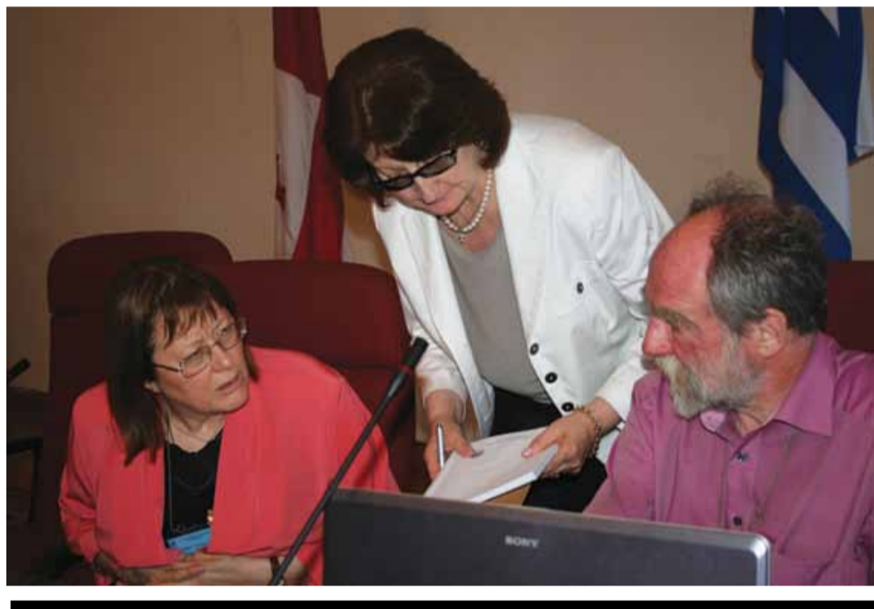
სიმპოზიუმზე ქართული ლექსიკოგრაფიის სამი ყველაზე აქტიური საკითხი დაისვა: ეროვნული კორპუსის შექმნა, ქართული ტერმინოლოგიის განვითარება და აკადემიური ლექსიკონების გამოყენების საკითხი უცხო ენების შესწავლის დროს.

ქართული ენის ეროვნული კორპუსის შესაქმნელად მხარდაჭერა გამოთქვა მანის ფრანკფურტის გოეთეს უნივერსიტეტის პროფესორმა იოსტ გიპერტმა. მან სიმპოზიუმზე წამოიწყო წარმომადგინა სახელწოდებით „დიაქრონიული ეროვნული კორპუსის საფუძვლები“. მოხსენებაში საუბარი იყო მთელ რიგ საკითხებზე, რომელთაც განსაკუთრებული მნიშვნელობა აქვთ დიაქრონიული ეროვნული კორპუსის შედგენისათვის და რომლებიც ლექსიკოგრაფიული კვლევებისთვის მნიშვნელოვანი საფუძველია. იოსტ გიპერტმა ისაუბრა „სტანდარტიზაციის საერთაშორისო ორგანიზაციის“ ამჟამად შექმნილების პროცესში მყოფ ენობრივი კოდების სტანდარტის შესახებაც.