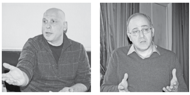
ლო პროცესისა და ლექტორების უშუალო მაკონტროლებელი „აქტიორები“.