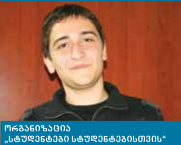
ორგანიზაცია „სტუდენტური სტუდენტობისთვის“

სარგი ფანცალავილი: ვაპირებთ, რომ უმრავლესობით მოვიდეთ ამ არჩევნებში, ღვაპიკავოთ იმადანი ადგილი, რამდენიც არის!