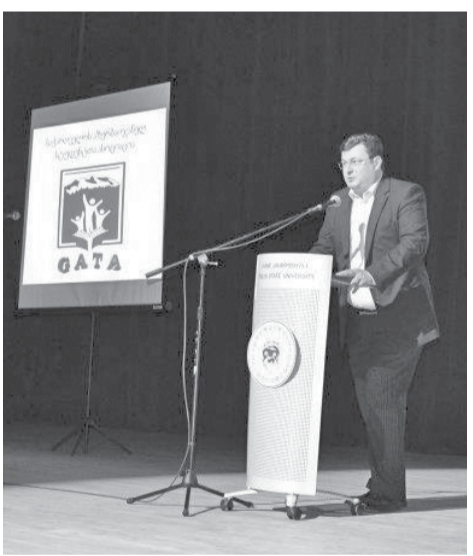
იმაზე, რომ მათი ინტეგრაციის პროცესი წარმატებით მიმდინარეობს, — განაცხადა ალექსანდრე კვიციანი.

გილემ ნოდარ სურგულაძემ ისაუბრა. „საქართველოს განათლებისა და მეცნიერების სამინისტრო ახორციელებს პროექტს, რომლითაც ერთიან ეროვნულ გამოცდებზე საქართველოს მოქალაქე აზერბაიჯანელი და სომეხი აბიტურიენტები უმაღლეს სასწავლებლებში ჩარიცხვისას სპეციალური კოტეჯით სარგებლობენ — ისინი მხოლოდ ზოგადი უნარების გამოცდას მშობლიურ ენაზე (აზერბაიჯანულად და სომხურად) აბარებენ, ერთი წლის განმავლობაში ქართულ ენას ინტენსიურად სწავლობენ და შემდეგ წელს სასურველ ფაკულტეტებზე სწავლას უკვე უმაღლესი განათლების მისაღებად აგრძელებენ. წელს ასობით სომეხი და აზერბაიჯანელი აბიტურიენტი არჩევანს სამინისტროს მიერ სწორედ ამ დანერგულ პროგრამაზე აკეთებს, მაშინ, როდესაც პროექტის დასაწყისში აღნიშნულ ინიციატივას მხოლოდ 3-4 მსურველი ეხმაურებოდა. ყოველივე ეს იმაზე მიუთითებს, რომ საქართველოში ეთნიკური უმცირესობების ინტეგრაციის პროცესი სწორი გზით მიდის“, — განაცხადა ნოდარ სურგულაძემ.