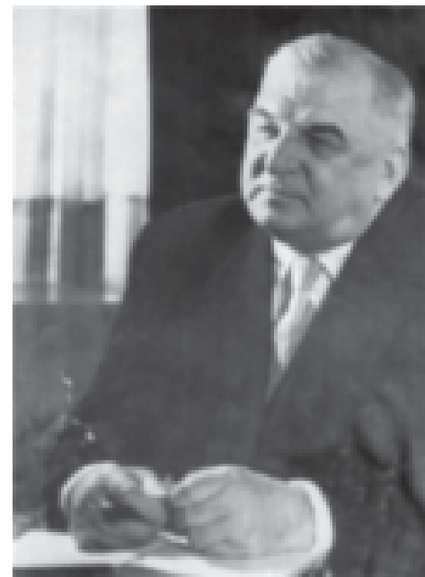
ბრძანდით, - გამოგვიცხადა.