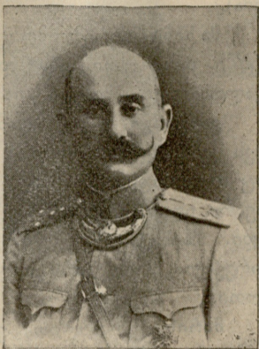
პორ. თავ. არჩილ ბაგრატიონ-დავითაშვილი. (დაჭრილია).