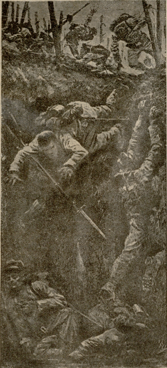
გერმანელების მიერ გაკეთებული ფარული ორმოები მავთულის ხლართების უკან.

კვლავ განაგრძობთ უდროოდ შეწყვეტილი შრომის წერას.