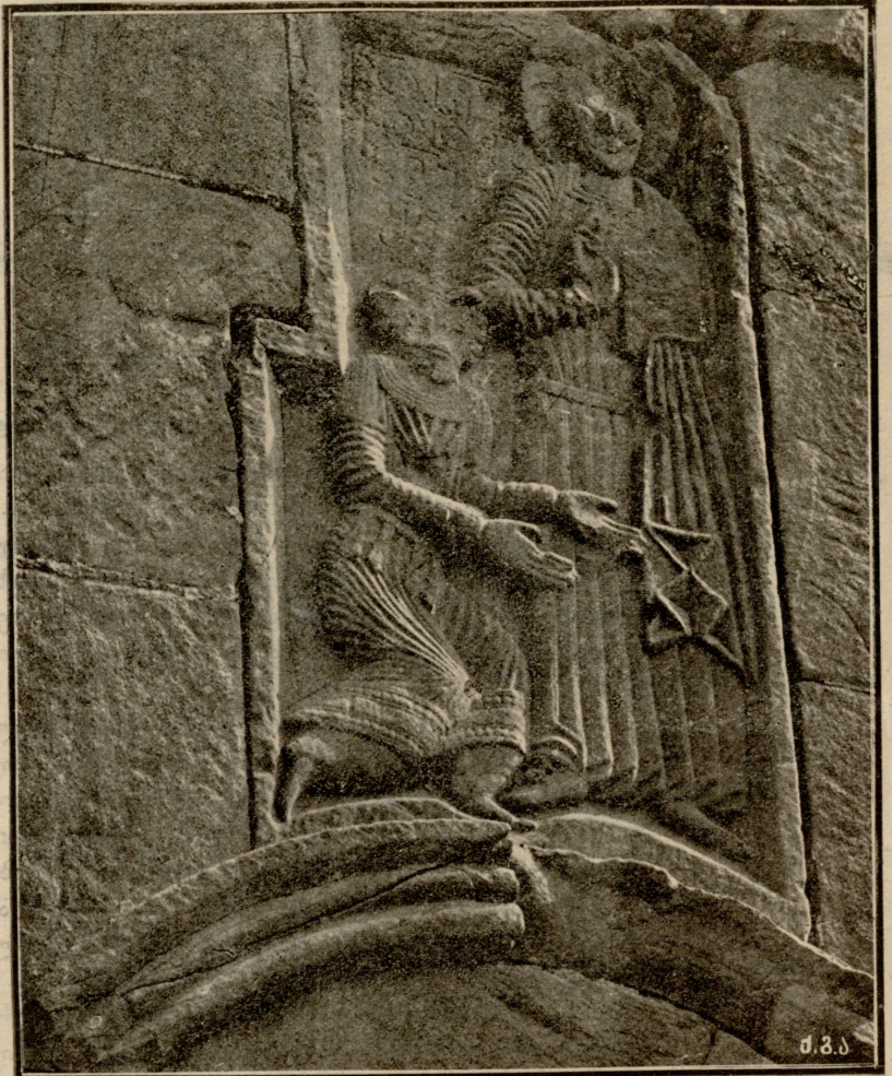
ჯვარის მონასტერი. ქანდაკება აღმოსავლეთის კედელზე.