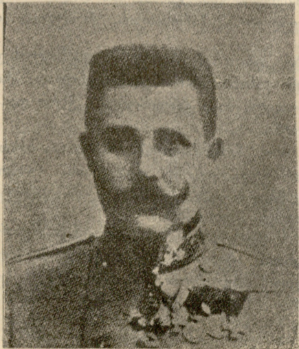
ავსტრიის მოკლული ერცჰერცოგი ფრანც-ფერდინანდი.

აი საქმე რაში იყო. სოფლის მოშორებით ერთი კარგი დიდი ბინა იყო, რომლითაც მთელი სოფელი ირჩენდა თავსა და გამო- დიოდა. აქა ჰქონდა სახნავი და სათესი, საჩალთიკე (საბრინჯე) ად- გილები, ფურცლის ბაღები და სხვა. მიწის სივიწროვით შეწუხე- ბულს სოფელს ეს ბინა რომ არა ჰქონოდა, ცუდათ იყო იმისი საქ- მე. მაგრამ უხსოვარს დროიდგანვე სოფელს ეს ადგილი ჩაევლო ხელში და ხმარობდა. საუბედუროთ ეხლა ამ მამულს მოდავეთ გა- მოსჩენოდა ერთს დროს გამოჩენილი შემამულე, მაგრამ ეხლა გალა- რიბებულ-გალატაკებული ათამბეგი, რომელსაც ყოველივე თავისი მამული და საცხოვრებელი მიეფლანგ-მოეფლანგა და როგორც გა- კოტრებული ურია ძველს თამასუქს გამოხანავს ხოლმე, ისე ეხლა ათამბეგსაც, სადღაც გამოეჩქენა რომ მისი წინაპარნი ამ მამულის მფლობელნი ყოფილიყვნენ. გაუთავებელი და დაუსრულებელი დავი- დარაბა დაეწყო სოფლელებისათვის. მამული მემკვიდრეობით მე