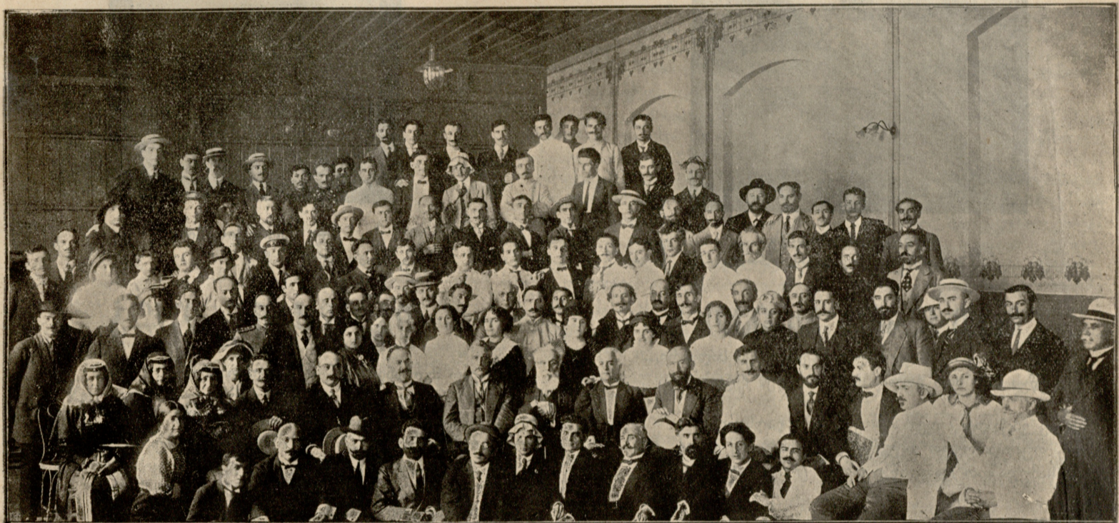
სრულიად საქართველოს სცენის მოღვაწეთა პირველი ყრილობა ტფილისში.