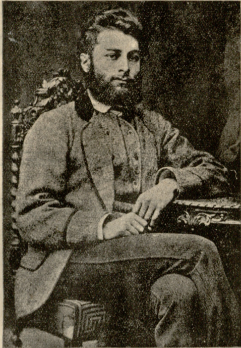
ალექსანდრე ყაზბეგი პეტერბურგში ყოფნის დროს.