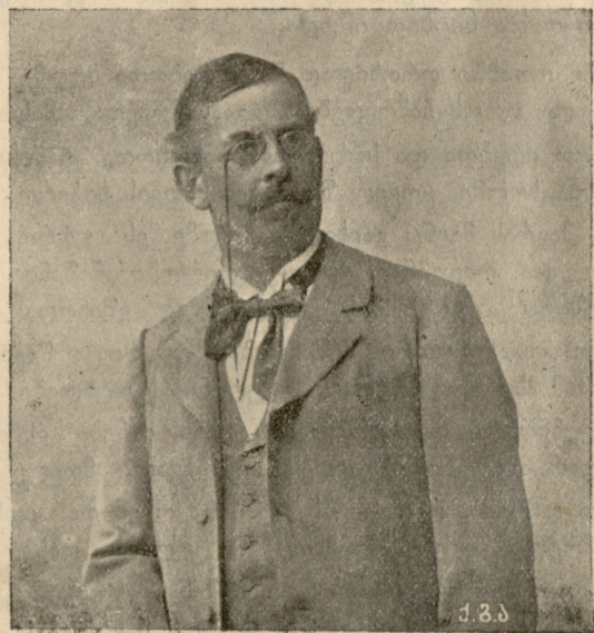
გამოჩენილი მეცნიერი, პროფესორი ჰუგო უზხარაძი ქ. (მისი მოღვაწეობის 50 წლის შესრულების გამო)

დიმიტრის აგონდებოდა ხოლმე თავისი მამა, თავადი ესტატე: მძიმე, დარბაისელი, წვერ-მოპარსული და დიდ-ულვაშა. მას მუდამ