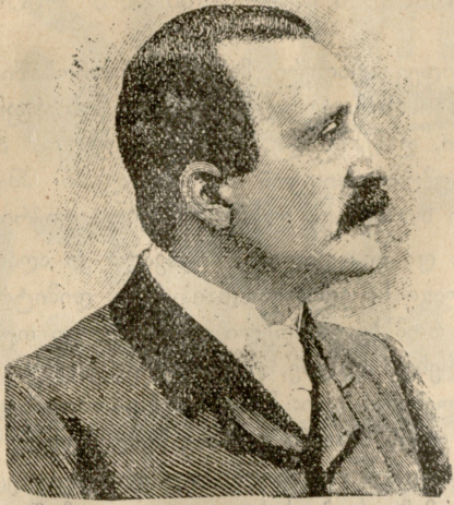
რ ე ნ ე ზ ი ზ ი ა ნ ი . საფრანგეთის მინისტრთა საბჭოს ახალი პრემიერი.

ხელი მოუმართო! ჩვენც კარგად გავუძღვებით საქმეს. მაშ ასე შე- შლილებით რად დავრბივართ? — ჰფიქრობდა დიმიტრი. ისიც კი ეგონა, რომ ანომ თეფში ტყუილად წაიღო სათონეში: ეხლა ეს თეფში არავისთვისაა საკირო. მაგრამ დიმიტრი უფრო შვილის ძა- ლიან აღმა-ცერად გადმოხედვამ დააფიქრა. რა იყო ამ გადმოხედვა- ში დაფარული. ან რატომ პირდაპირ არ შეჭებდა, თუ კი შეხედვა უნდოდა? — გაიფიქრა დიმიტრამ და ამ გადმოხედვაში მან დაინახა: შიში, მისდამი წყენა, გამტყუნება, თითქოს ის იყო დამნაშავე ამ არეულობისა.