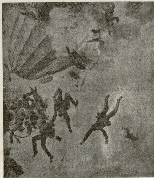
ღრამა ჰაერში. (იხ. ლ. „სახ. გაზ.“)