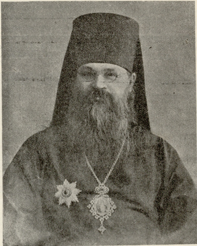
საქართველოს სახალი ექსარხოის ალექსი.

ალ. (გამოართმევს და კონვერტს აკვირდება).