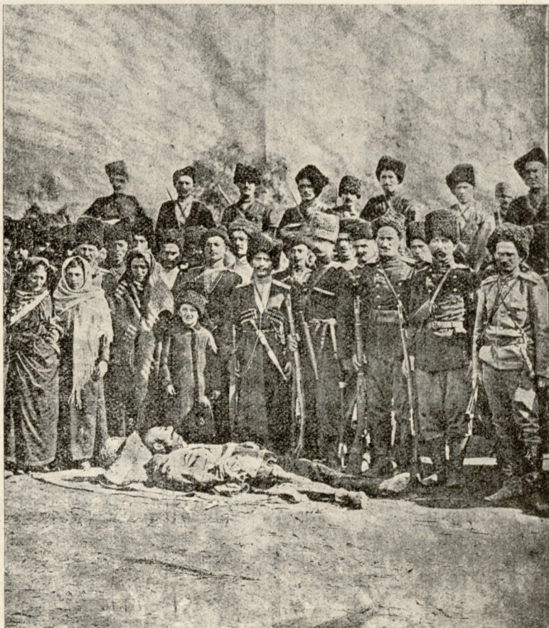
ცნობილი ყაჩაღის ზელიმხანის მოკვლა 1) ზელიმხანის ქალი, 2) მისი სიდერო, 3) მისი ვაჟი, 4) რაზმის უფროსი.

გაღია. აბა, რა გულით მივხედო საქმეს, როცა შენ ასეთ გუნებაზე მყევხარ?!..