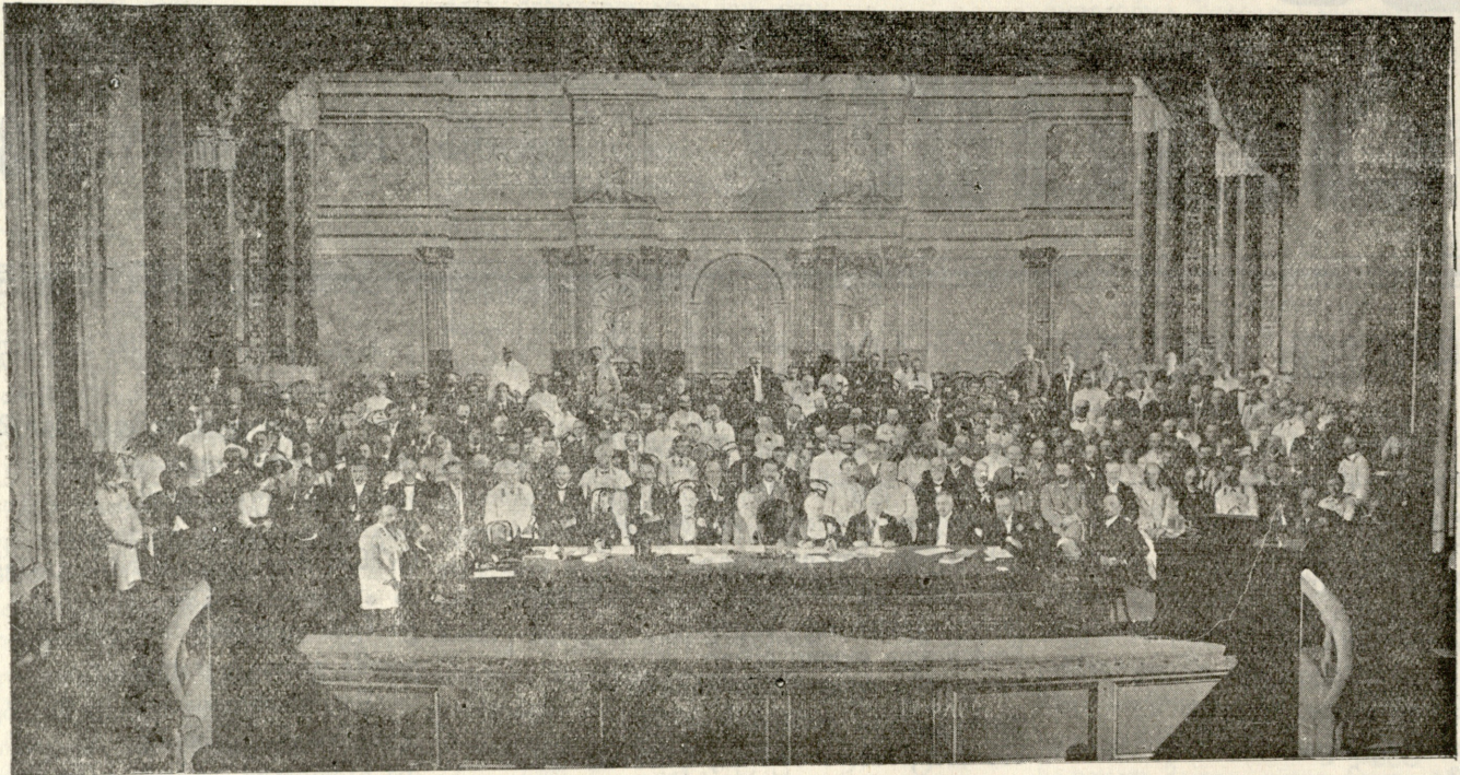
კრების პრეზიდიუმი. ტფ. სახაზინო თეატრის სცენაზე სექციების საერთო სხდომის დროს.

ვკვდებით—მაინც ვიტანჯებით. ასე მივალთ! და სად მივალთ? რად ვიშობეთ, ან რად ვკვდებით! ნეტა იმას, ვისაც რწმენა იმ ქვეყნისა ასულდგმულებს; იგი მაინც თავს იტყუებს და იყუჩებს ამით წყლულებს, ეხ, სადღაა, მეგობარო, შენი აზრი და გონება? ვიდრე ვცოცხლობ, შენი მქონდეს მარტოოდენ მოგონება, როს მოგვკვდები, ეს მცირედიც ჩემთან ერთად აღიფხვრება. და აქ სული რაღას აქნევს, თუ კი ჩვენთან იგიც კვდება. რჩეულთ თავი რითი მოაქვთ? რაა მათი უკვდავება? ნუ თუ ის რომ შევიცანით და ვუძღვინით სოფლად ქება? ჩვენში ძეგლი აიშენეს და მით ჰპოვეს უკვდავება? მაგრამ ჩვენ თუ დავიხოცნეთ, ან მოისპოს მთლად ცხოვრება, სად ვინლა სთქვას, ვინ ახსენოს მარადობა, უკვდავება? ქეშმარიტად ყველა მიდის... ქეშმარიტად ყველა ჰქრება. მაგრამ ვიდრე ქვეყნად ვცოცხლობთ ასე უნდა გვქონდეს მცნება, რომ ცხოვრებით ვისარგებლოთ, წინ გვიძლოდეს გამარჯვება. შვილიშვილი უზრუნველყვით, ავუყვავით მას დიდება; ძალა ჩვენი მოვიკრიფოთ... ასე უთქვავს მგოსანს ქება! ესთქვი, სუღარას გადავხედე, კელაპტარი კვლავ იწვოდა, შეუცნობელ გრძობებისგან გული ჩემი ესრე თრთოდა. იქვე ახლოს საათისა რაკარუკი მომესმოდა და მამცნობდა: ყოველ წუთით ამ ცხოვრებას ვშორდებოდი. ყოველ წუთით შეუმჩნევლად სიკვდილს ვუახლოვდებოდი. ვიგრძენ გულში მე სიცივე, ჟრუანტელმა დამიარა,