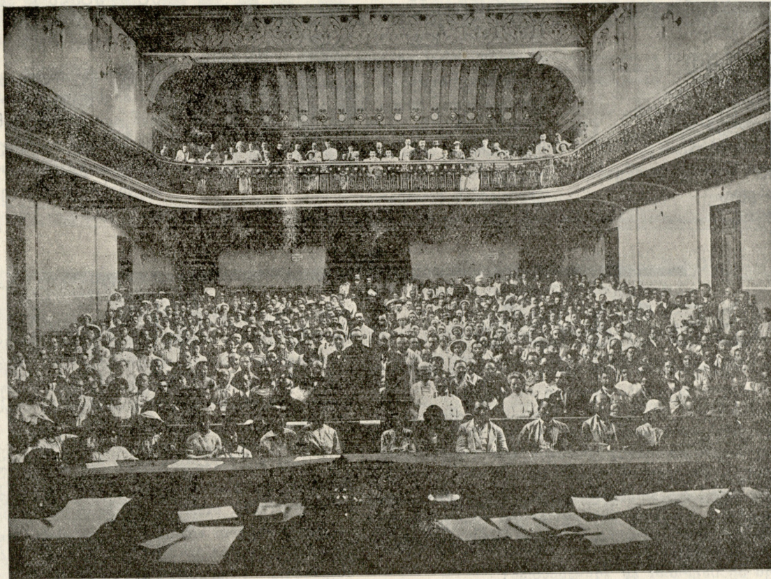
საპედაგოგო სექციის სხდომა ძმ. ზუბალაშვილების სახელობის სახალხო სახლში.

გავლენაა მგობრისა... მაგრამ ჩემს თავს თუ მკვიდრად ვგრძნობ, არცა მჯერა არათურისა; მაშ რაღად მაქვს მოლოდინი?... მოლოდინი აჩრდილისა?... ამოვიღე კვლავ წერილი, ხელში ვსრესდი, ვაბრუნებდი. და ზებირად შინაარსსა აზრში ბუნდად ვაცურებდი. რაო? მოგცემ ნიშანსაო? ამ სუღარის შეტოვება, ან შრიალი იღუმალი... ნერვებ აშლილს მელანდება! მაგრამ ჩემს თავს რომ კარგად ვგრძნობ, თანვე მახლავს ჩემი ნება? ასე ვსთქვი და ვავიგონე რომ ფანჯარა დარახუნდა. ბიჭოს?! ნუ თუ? ეს რა მომდის, გული რაზე შემობრუნდა? ალბად ვისმეს კენჭის სროლით დაძახება ჩემი უნდა. ან და ქარმა დაუბერა— მაშ აქ სხვა რა მოჰხდებოდა? ჩემი აზრი ჩემსავ გრძნობას ასე გვარად შეებრძოდა. რომ რაკუნთ ხელმეორედ და გარკვევით გავიგონე, ავცახცახდი. რაზედ ვშიშობ? რად დავკარგე ჩემი ღონე? თუ ვიხილავ, — ჩემს მეგობარს! მაგრამ როგორ დავიჯერო? ჩემი თავი მეუბნება: გამოეგე გონსა, შტერო! და კიდევ რომ რამე მოხდეს, ვოგიმ მომცეს სხვა ნიშანი? სწორედ ჰქვაზე შევიშლები, დახე, ყალყზე მიდგა თმანი! აი თუნდ რომ ის სანთელი...— ვსთქვი და... ჩქარა კელაპტარი; მას ვიღამაც შეუბერა, ეს არ იყო, ვაცი, ქარი; უფრო მეტად ავცახცახდი, გულის ცემა შექმნა ჩქარი. წამოვიჭერ, გამოვვარდი, მოვიხურე მაგრა კარი და მეორე ვრცელ ოთახში