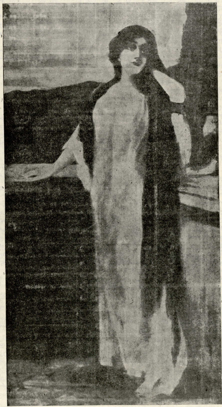
დაკარგული ბედნიერება.— ნახტი ებერინისა.

თანდათან უფრო შეუყვარდა ელისბარს თავისი მიწა-წყალი. რაც უფრო მეტი ამაგი დასდო მან თავის მამულს, იმდენად უფრო დაუახლოვდა მას, გაიცნო და დაუკავშირდა. მამულმაც მეტი ნდობით გადუსხნა მას გულ-მკერდი და მეტი იმედი მისცა თავის ერთგულ პატრონს. ერთი-ორად გამხნევდა ვაჭაკი: სამაგალითო გახადა თავის მამული, თითოთ საჩვენებელი. დაამტკიცა, რომ ჯერ არ მომკვდარა ის ქარფველი, რომელიც უხსოვარ ღროშივე განთქმული იყო თავის მიწისადმი სიყვარულით, მის აზრიანად მოვლით. და ეს მრომა თუ ზრუნვა სრულებითაც არ იყო მისი მტანჯველ-მომღვარსლელი თუ დამაბეჩავებელი, როგორც აბეჩავებს ადამიანს დღიურ ლუკმისათვის უზომო ჯათა, როდესაც ადამიანი იძუ-