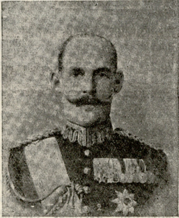
კონსტანტინე საბერძნეთის ახალი მეფე.

ჟამად სუსხიანი ქარი ქვეყნის სიავისა თუ დაუდგრომლობისა, გარნა ეს მსუსხავი ნიავე-ქარი გარეგანი იყო, მათ ორთა პიროვნობათა გარეშე არსებულის სიავისაგან მონაბერი და ცოლ-ქმარი ებრძოდა ამგვარ სიღუბსიერეს მწყობრად, მხარდა მხარ, განუყრელ-განუყოფელად, და ასუსტებდნენ იგინი ბოროტის სიმწარეს, უკლაქცევდნენ მის ძალას მავნებელს.