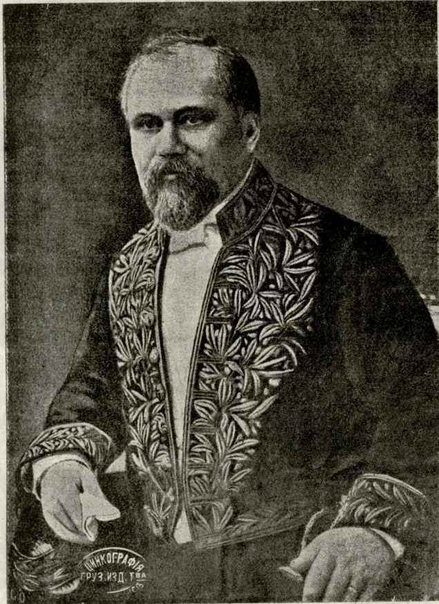
საფრანგეთის ახალი პრეზიდენტი რაიმონდ პუანკარე.

— მომისმინეთ! — ხმა მალლა წამოიყვინა გამომძიებელმა და ასადგომად მოემხადა.