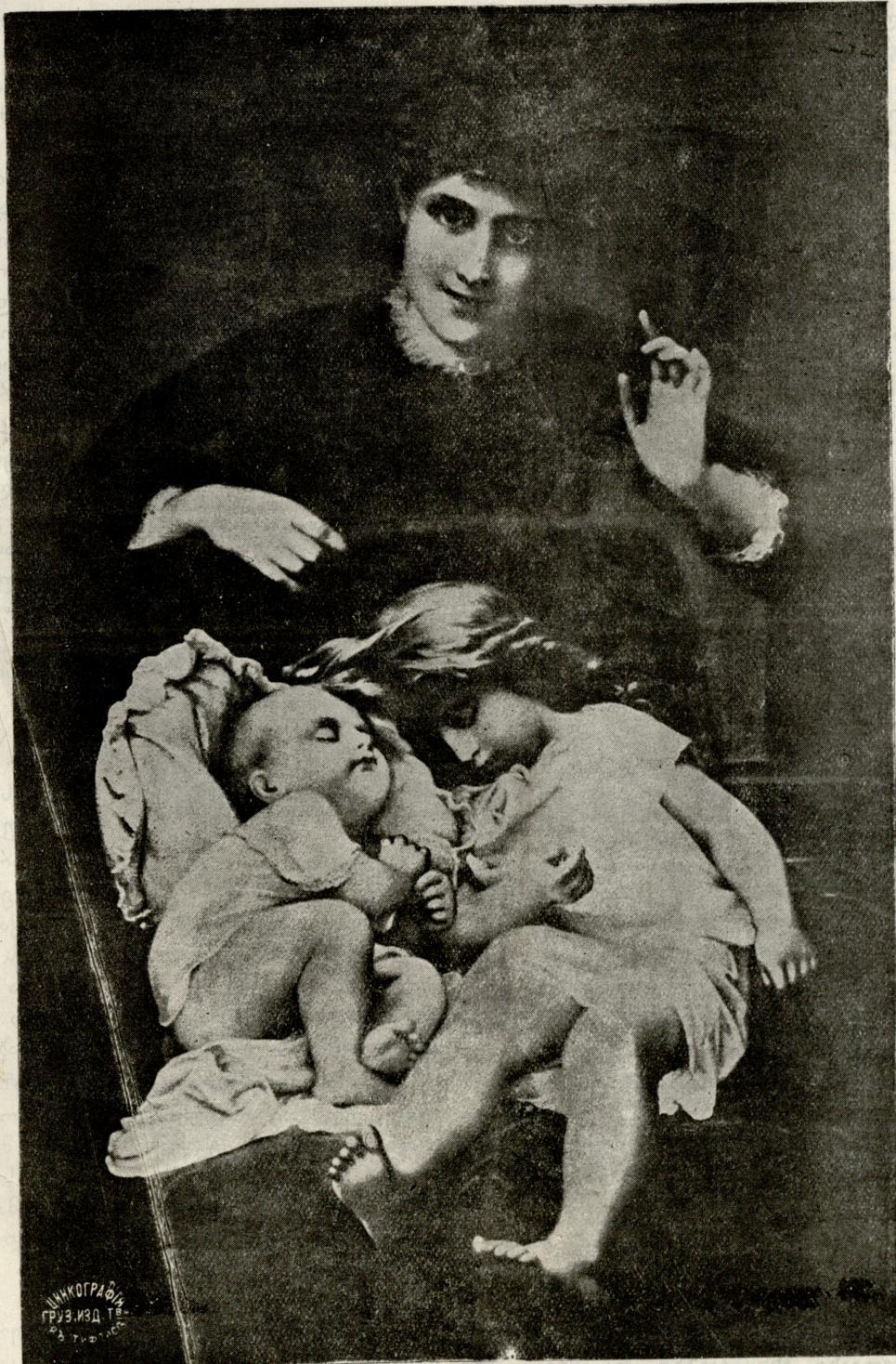
წყნარად, წყნარად, არ გააღვიძოთ!

— ასე, ჩემო მეგობარო!—ეუბნებოდა ახალგაზდა, კოხტად გამოწყობილ გამომძიებელ ვერიგინს, რომელიც ერთ გამოძიე- ბიდან მეორე გამოსაძიებელ საქმის მოგზაურობის დროს, ძალა- უნებურად, მასთან ჩამომხტარიყო.—ეგ, მხოლოდ მიღებულია, რომ აგრე იფიქრონ... რადგანაც მათთვის ეგ უფრო ხელსა- ყრელია... ვითომ ყველანაირი ქირი, სამართლის შეუსრულებ-