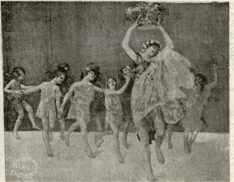
იზიდირა დუნკანის ცეკვა პატარა მოწაფეებით.

და იმ ხელს, რომელმაც ის იყო ისე მხეკურად მოჰკლა მისი დედა და და, წოვნით კოცნა დაუწყა!.. მთელი სახე დე-