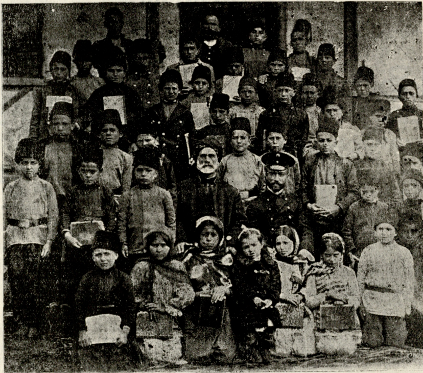
აწყვერისი (მესხეთში) სამინისტრო სკოლის მოწაფეები, რომელთაც განიზრახეს ქართული წერა-კითხვის შესწავლა. მოწაფეებია ყველა ქართველი მაჰმადიანები არიან.

მალე „ბედნიერი ცოლ-ქმრობა“ და წერილი ფეფლად იქცა.