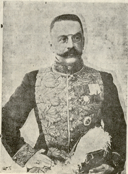
შინაგან საქმეთა ახალი მინისტრი

მედღემა წიგნი დიდის ყურადღებით გადაიკითხა, ბევრი შენიშვნები გაუკეთა ალაგ-ალაგ და ზოგიერთი ადგილები ზეპირადაც კი დაისწავლა. რობერტისთვის კი არა უთქვამს რა ამ წიგნის თაობაზე.