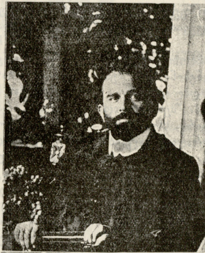
† თ-ლი იური ჭავჭავაძე.