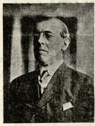
ამერიკის შეერთებული შტატების ახალი პრეზიდენტი ვუდრო ვილსონი.