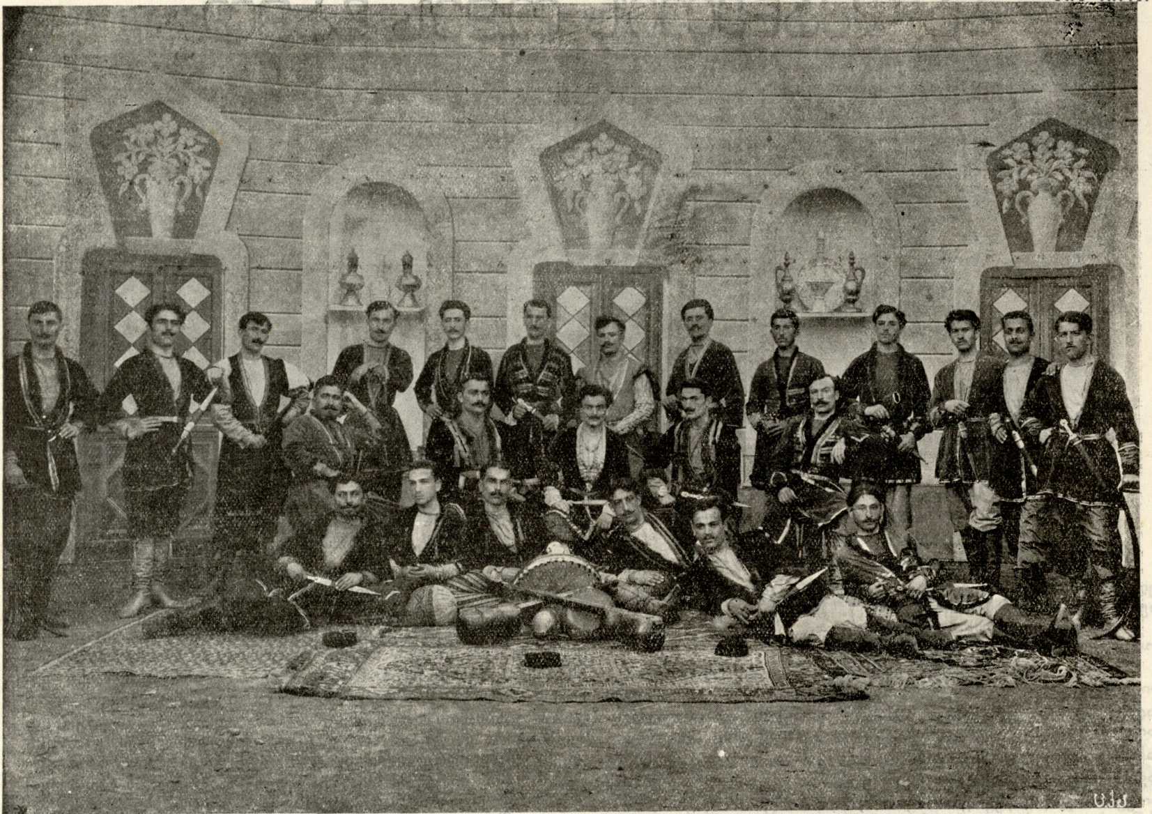
მ. კახიანი მამულერალთა გუნდი.

ლიხარ! შენის საქციელით ფეხქვეშ გასთელი და ტალახში ამოსვარე ქალის პატიოსნება და თავმოყვარეობა... შენ შეურაცხვე იმის უმწიკვლო სახელი... გავიწყდება რომ მე, — შენი მეუღლე, შენი მეგობარი და საყვარელი არსებმ ვარ. რაღაც გაუგებარ რამეს მეკითხები და მით შეურაცყოფას მაყენებ. თუ პატივსა მცემ და გიყვარვარ, — კიდევ უნდა გჯეროდეს ჩემი... — სთქვი სიმაართლე, თორემ ახლავ სიცოცხლეს მოგისპობ! — თავდავიწყებით შეჭყვირა შურისძიებით შეპყრობილმა გრაფმა, რომელსაც თითქოს არც კი გაეგონა ჟაკელინას სიტყვები.